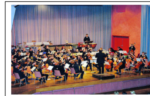
JUGEND- SYMPHONIE- ORCHESTER